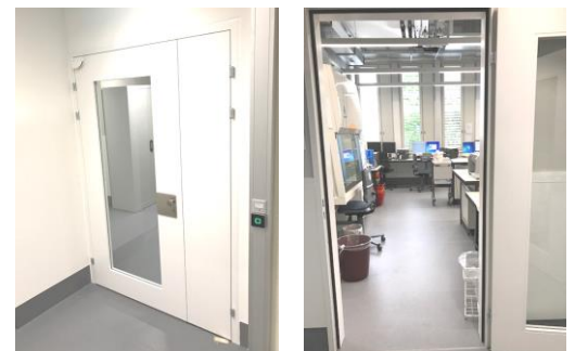
Probenannahme Stockwerk H

Institut für Medizinische Mikrobiologie Gloriosastrasse 28 8006 Zürich